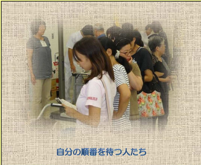
自分の順番を待つ人たち