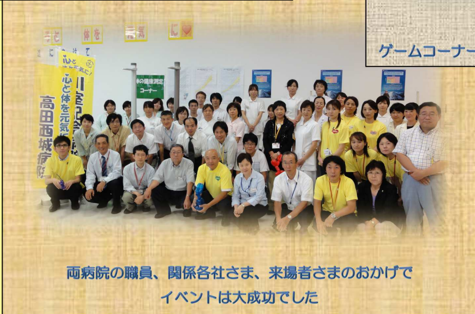
両病院の職員、関係各社さま、来場者さまのおかげでイベントは大成功でした