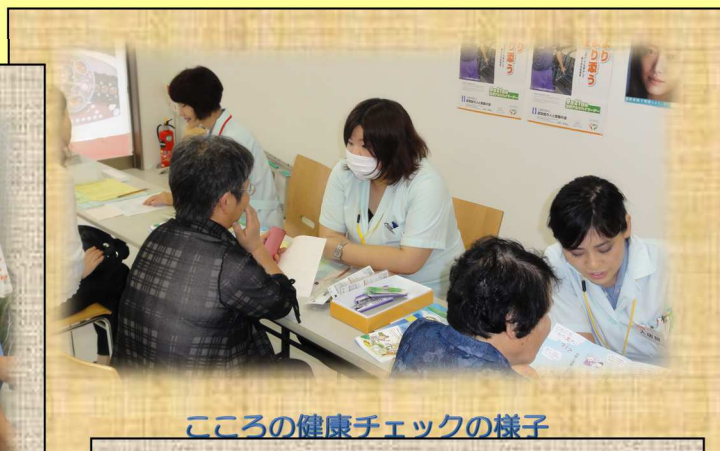
こころの健康チェックの様子