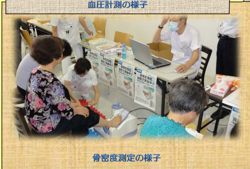
骨密度測定の様子