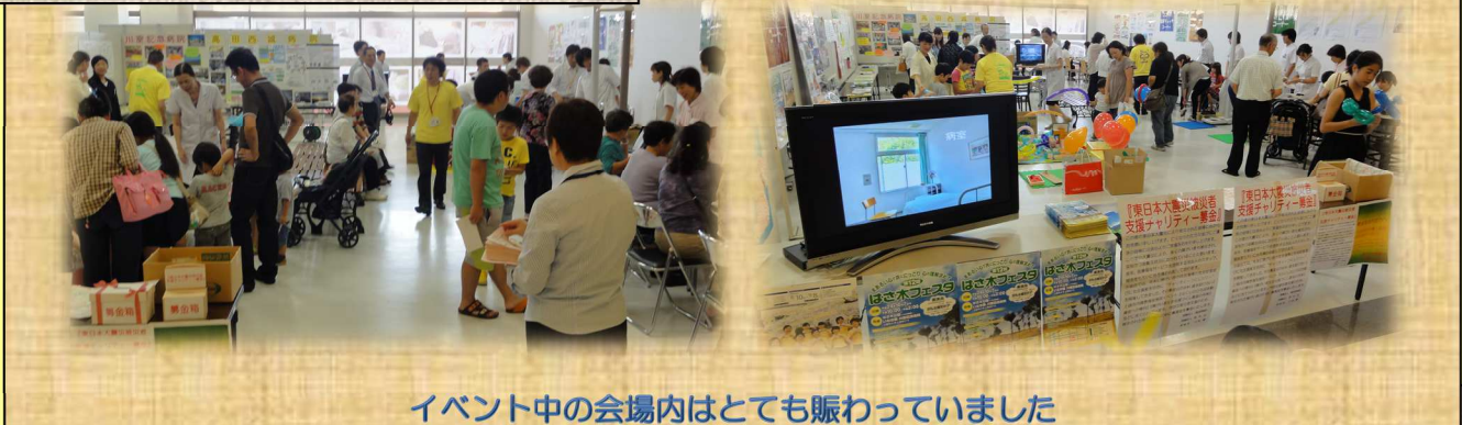
イベント中の会場内はとても賑わっていました