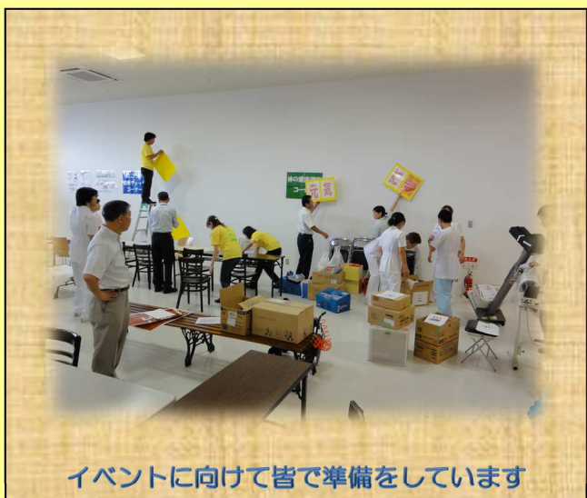
イベントに向けて皆で準備をしています

当日は大変多くの方々に足を運んでいただき、大盛況のうちにイベントを終了することが出来ました。