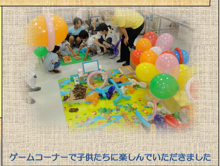
ゲームコーナーで子供たちに楽しんでいただきました