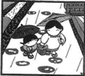
「1文字」の風景 原上 文

「ババさま」 夫の急病 発達障害者の半人分、休む 時間すら確保できず、休む 時間すら確保できず、休む 時間すら確保できず、休む