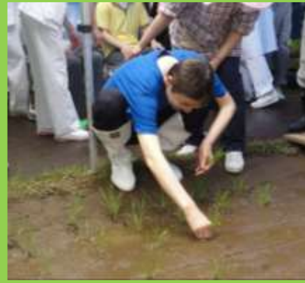
田植え体験：まずは、理事長先生から。その後、みんなで協力して植えました。