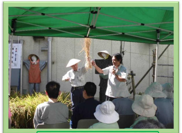
稲の刈り方について説明